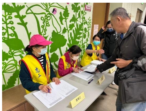
志工協助講師及學員簽到