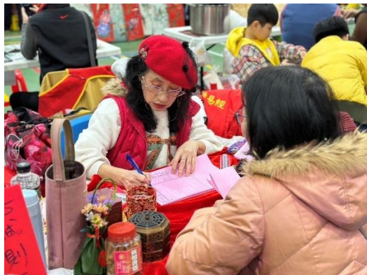
靜態課程用心佈置攤位，與民眾互動

104 年開始，竹北社區大學和竹東社區大學皆由敏實科技大學承辦，成果展以共同承辦模式舉辦，而地點則是一次在竹東，一次在竹北，成果展當天為新學期招生最佳時機，內容豐富多元，不只吸引竹北社區居民闖家參觀，也讓每門課的講師飽足教學成果的癮。