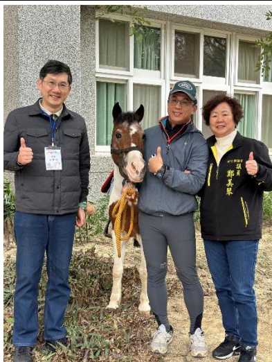
新竹縣議員蒞臨本校成果展，與曾主任、社大講師合照