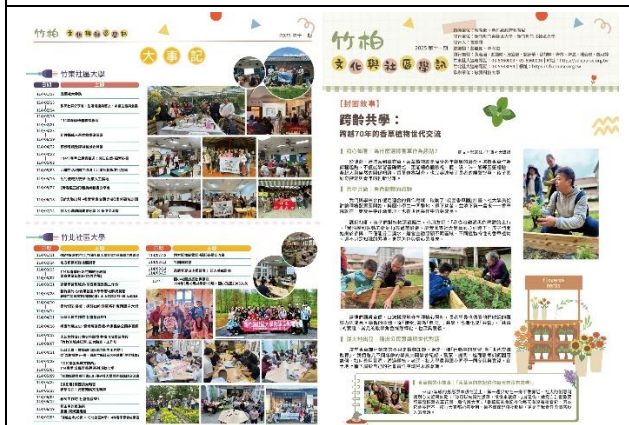
《竹柏文化與社區學訊》第十一期