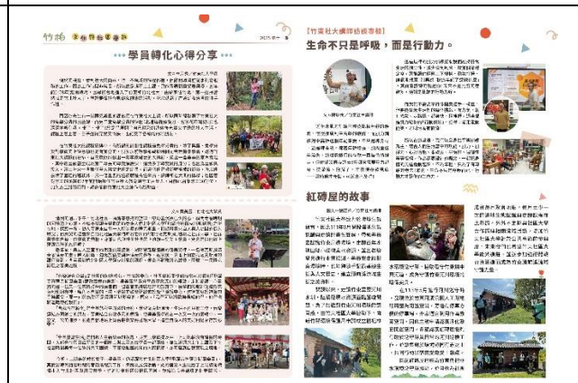
《竹柏文化與社區學訊》第十一期