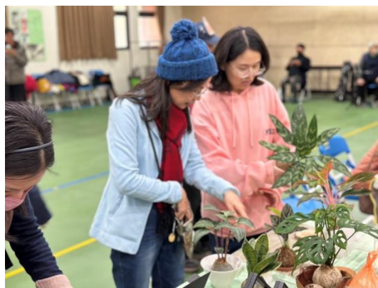
靜態課程用心佈置攤位