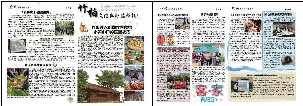
《竹柏文化與社區學訊》第九期

為能夠提高社大宣傳與推廣的力道，從 106 年起出刊的《竹柏文化與社區學訊》，是每年皆固定出版兩期的新竹縣地方性報刊，並在今年在竹東與竹北分別開設公民記者系列課程，培養公民記者，並將公民記者的文章刊載，增強報刊的對於民眾的貼近，也擴大社大的宣傳與教學力道。