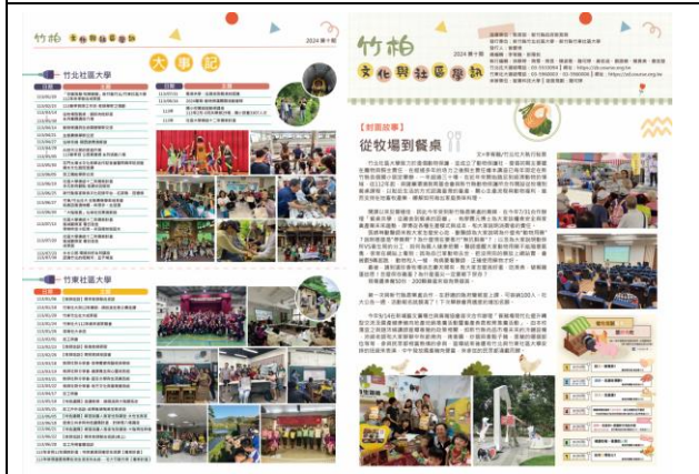
《竹柏文化與社區學訊》第十期