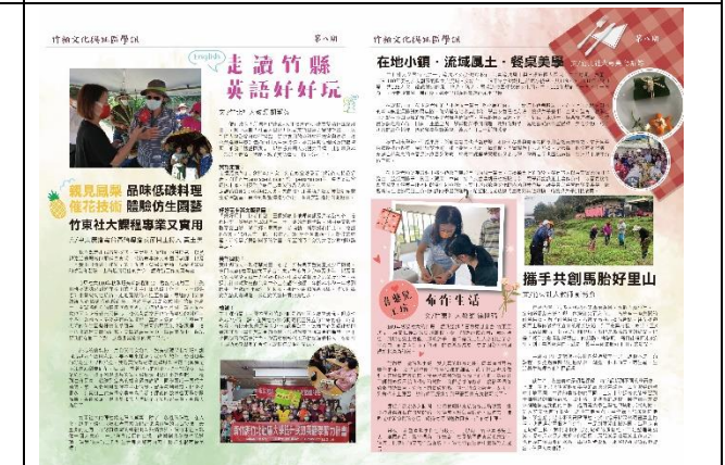
《竹柏文化與社區學訊》第八期