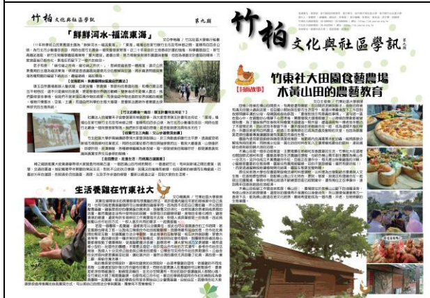
《竹柏文化與社區學訊》第九期