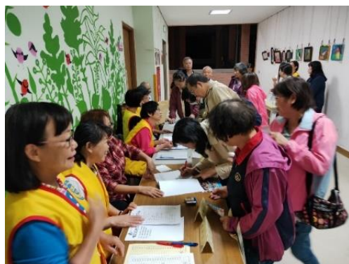
志工協助講師及學員簽到