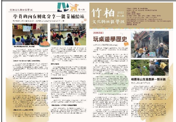
《竹柏文化與社區學訊》第八期