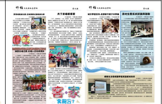
《竹柏文化與社區學訊》第九期