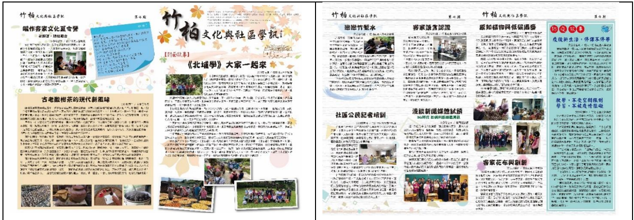
《竹柏文化與社區學訊》第七期

為能夠提高社大宣傳與推廣的力道，從106年起出刊的《竹柏文化與社區學訊》，是每年皆固定出版兩期的新竹縣地方性報刊，並在今年在竹東與竹北分別開設公民記者系列課程，培養公民記者，並將公民記者的文章刊載，增強報刊的對於民眾的貼近，也擴大社大的宣傳與教學力道。